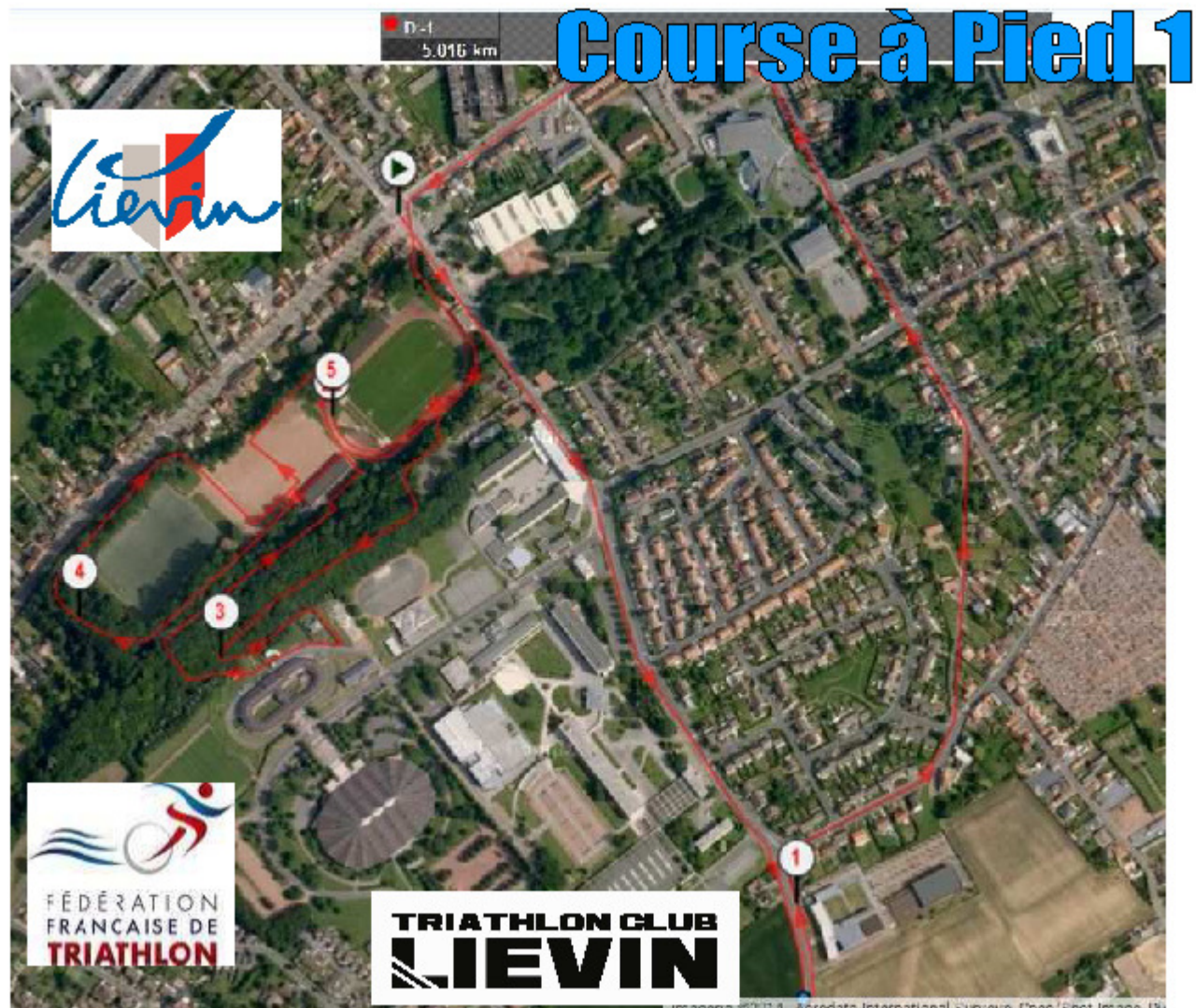
Course à pied 1 de 5km